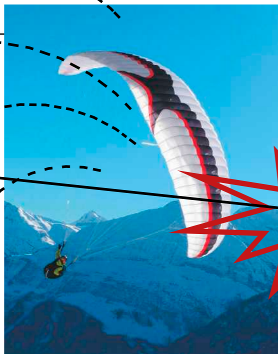
IQ-COMPETINO+/COMPEO+ sendet jede Sekunde die Position mit einem entsprechenden Radius aus.